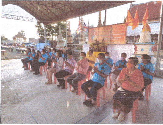
คำบรรยายภาพที่ ๑. พิธีเจริญพระพุทธมนต์.....