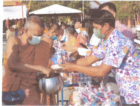
คำบรรยายภาพที่ ๒. พิธีทำบุญตักบาตร.....