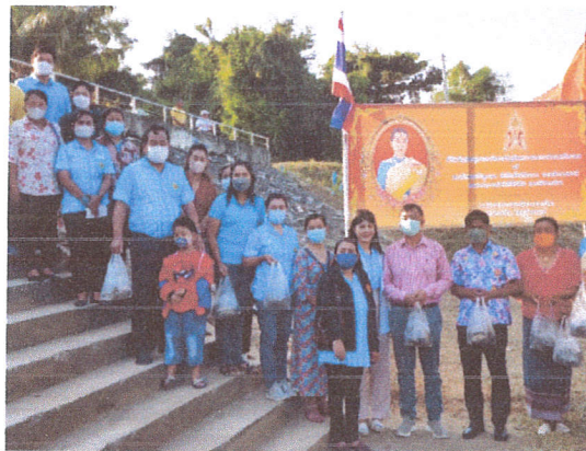
คำบรรยายภาพที่ ๓. พิธีปล่อยปลา.....